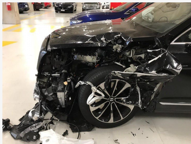
Fotografía segundo ángulo