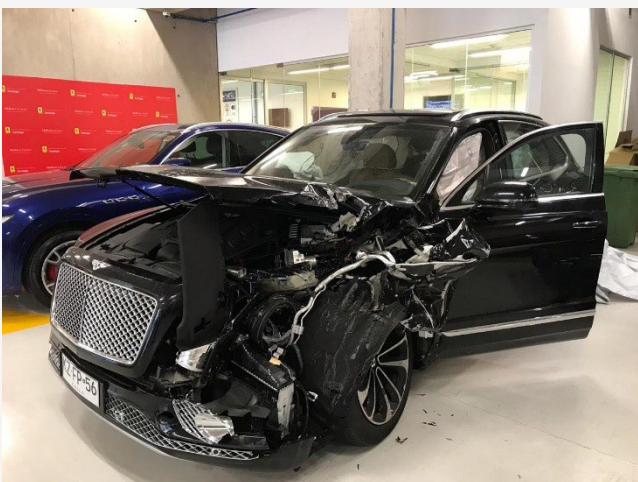
Fotografía plano general

Te recomendamos tomar fotografías desde los daños generales hasta los más específicos. Esta secuencia aporta coherencia a la información y facilita la comprensión de la dinámica del siniestro.